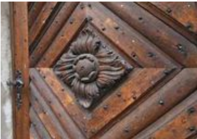
Restaurierte historische Tür am Kirchplatz 4 The restored historical front door at 4 Kirchplatz Porte ancienne restaurée, Kirchplatz 4

La maison historique Schmittmann sur la place de l’église. Elle fut construite en 1571 et fit office de mairie de 1864 à 1886.