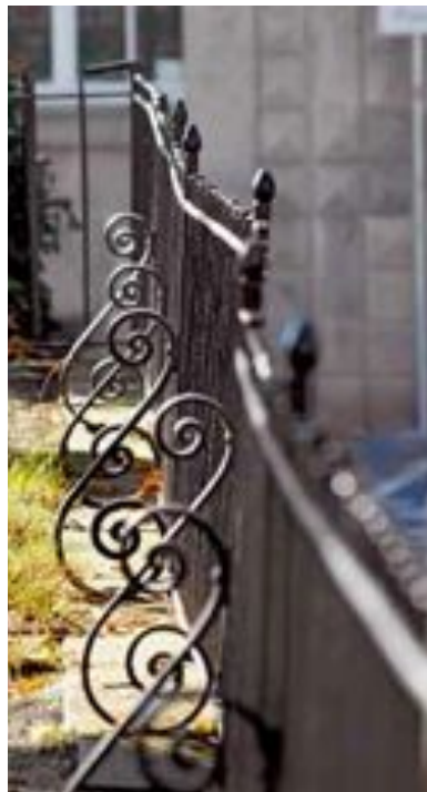
Schmiedeeisernes Geländer am Kirchplatz A wrought-iron railing at the church square Rambarde en fer forgé sur la place de l’église