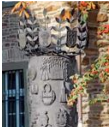
Die Geschichtssäule am Alten Rathaus

Le cheval Westphalien sur la coupole de l'ancienne mairie