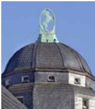
Das Westfalenpferd auf der Kuppel des Alten Rathauses

The Westphalian horse on top of the dome of the ancient City Hall